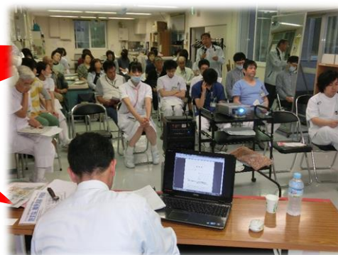
6月23日、弁護士を招いて学習会